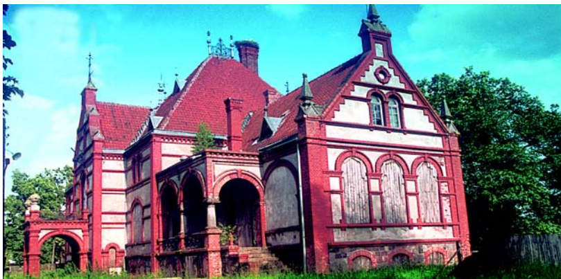
Turza Mała – pałac