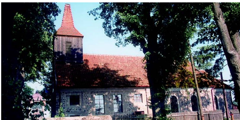
Kielpiny – kościół