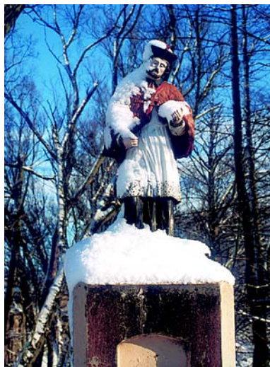
Figura św. Jana Nepomucena

np. przy ul. Chopina 1 (około 1900 r.), ul. Młyńska 4 (koniec XIX w.), ul. Podzamcze 14 (koniec XIX w.), ul. Nowy Rynek 11 (koniec XIX w.), ul. Sądowa 3 (początek XIX w.), ul. Słomiany Rynek 8 (koniec XIX w.), ul. Garbuzy 2 (XIX w.), ul. Stare Miasto 13, 17 i 19 (koniec XIX w.). Na uwagę zasługuje zachowany ciąg kilku secesyjnych kamienic na placu gen. J. Hallera z przełomu XIX i XX wieku (numery: 5, 6, 7, 8, 10). Kilka obiektów zostało wpisanych do rejestru zabytków. Są to następujące budynki: ul. Ogrodowa 15, ul. Słomiany Rynek 7, ul. Stare Miasto 1, 11, 12 i 31, ul. Podzamcze 14 (koniec XIX w.), ul. Sądowa 3 (początek XIX w.), ul. Słomiany Rynek 8 (koniec XIX w.), ul. Stare Miasto 1, 2, 6, 7, 10, 13, 15, 19, 31, 35 (wszystkie koniec XIX w.). Inne cenne zabytki budownictwa mieszkalnego to: ul. Dworcowa 7 i 11 (około 1900 r.), ul. Działdowska 4 (1848 r.),