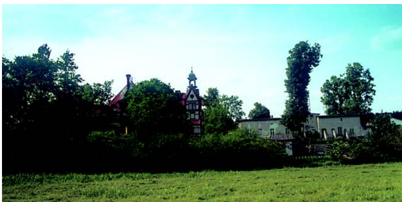
Turza Mała – pałac i budynek dawnego dworu