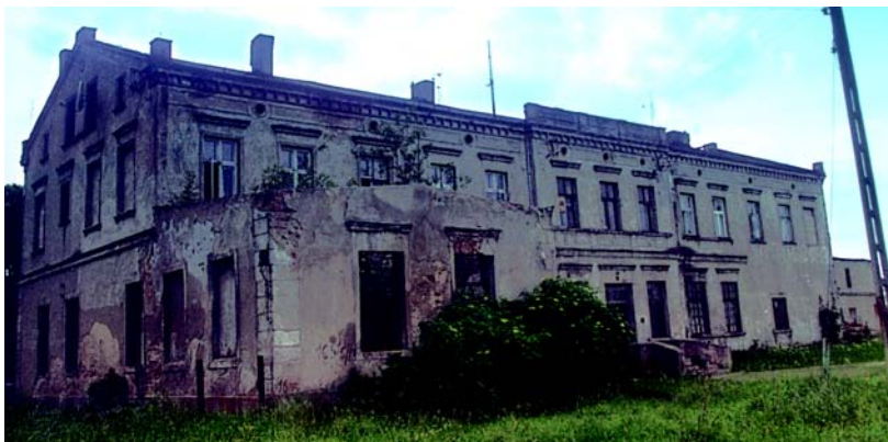
Koszelewy – pałac