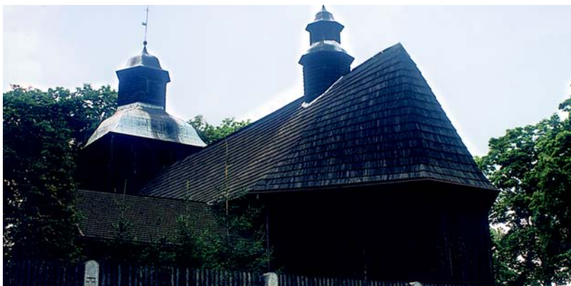
Rumian – kościół p.w. św. Barbary