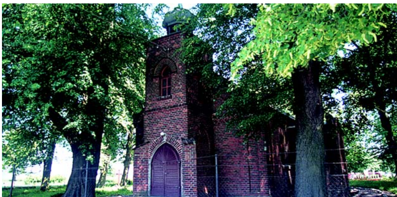
Wleusk – kaplica