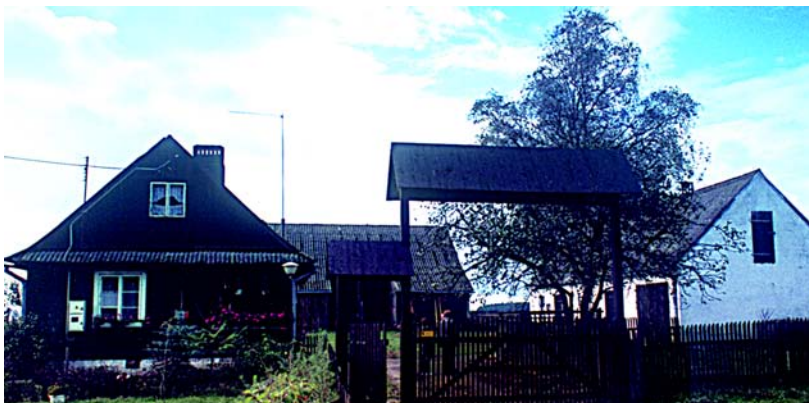
Ciechanówko – poniatówka