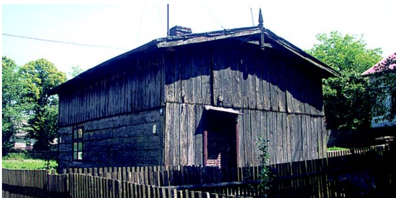
Stup – drewniany budynek mieszkalny