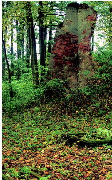
Szczupliny – ruiny kościoła ewangelickiego i dawny cmentarz