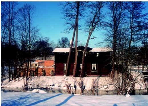
Dom przy ulicy Chopina

np. przy ul. Chopina 1 (około 1900 r.), ul. Młyńska 4 (koniec XIX w.), ul. Podzamcze 14 (koniec XIX w.), ul. Nowy Rynek 11 (koniec XIX w.), ul. Sądowa 3 (początek XIX w.), ul. Słomiany Rynek 8 (koniec XIX w.), ul. Garbuzy 2 (XIX w.), ul. Stare Miasto 13, 17 i 19 (koniec XIX w.). Na uwagę zasługuje zachowany ciąg kilku secesyjnych kamienic na placu gen. J. Hallera z przełomu XIX i XX wieku (numery: 5, 6, 7, 8, 10). Kilka obiektów zostało wpisanych do rejestru zabytków. Są to następujące budynki: ul. Ogrodowa 15, ul. Słomiany Rynek 7, ul. Stare Miasto 1, 11, 12 i 31, ul. Podzamcze 14 (koniec XIX w.), ul. Sądowa 3 (początek XIX w.), ul. Słomiany Rynek 8 (koniec XIX w.), ul. Stare Miasto 1, 2, 6, 7, 10, 13, 15, 19, 31, 35 (wszystkie koniec XIX w.). Inne cenne zabytki budownictwa mieszkalnego to: ul. Dworcowa 7 i 11 (około 1900 r.), ul. Działdowska 4 (1848 r.),