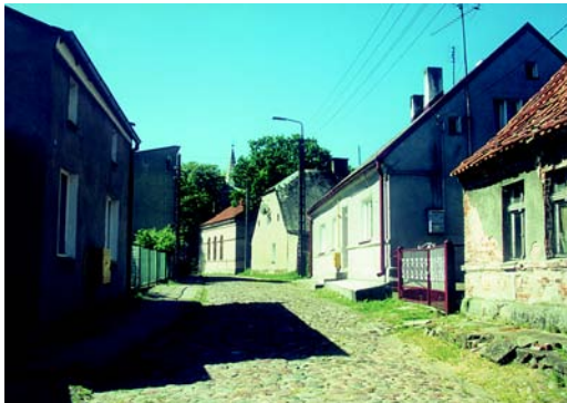
Ulica Górka, w głębi wieża kościoła ewangelickiego