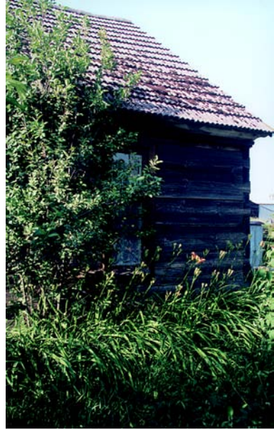
Kiełpiny – łączenie konstrukcji zrębowej na rybi ogon