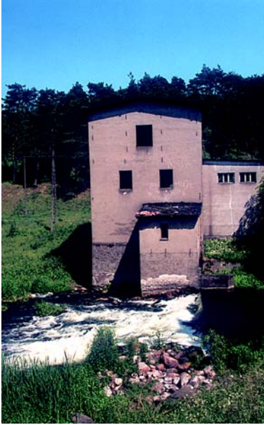
Chelsty – młyn wodny