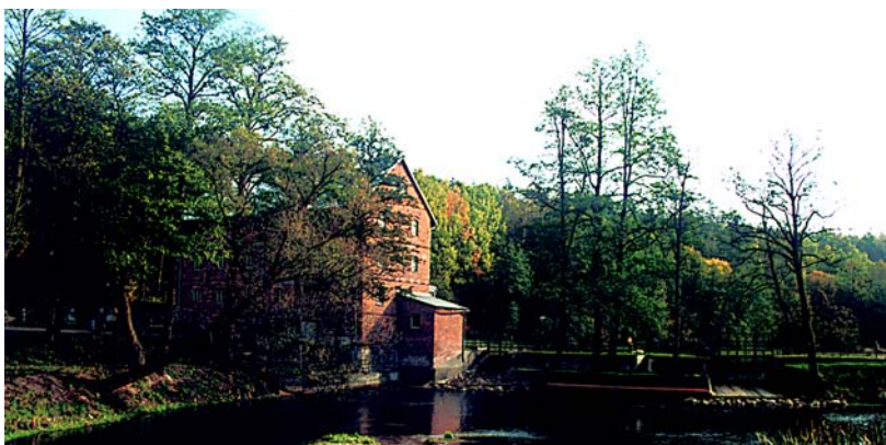
Kurojady – młyn wodny