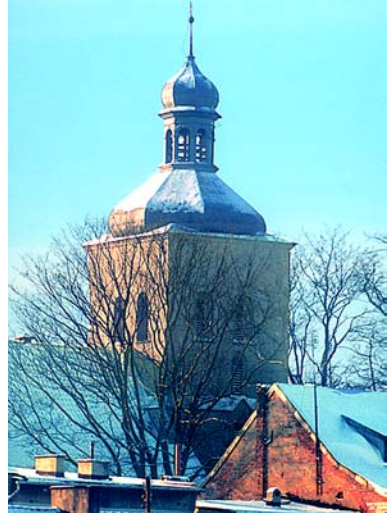
Wieża kościoła św. Wojciecha