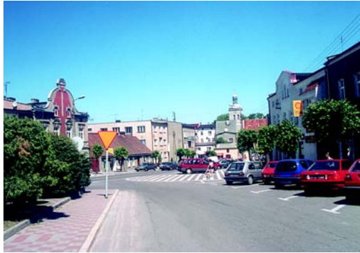
Ulica Nowy Rynek

Nad wejściem znajduje się napis: „Dom Boży”. Obok kościoła stoi murowany z czerwonej cegły dom parafialny z pierwszej połowy XX wieku. Istnieją pewne przesłanki świadczące o tym, że projektantem kościoła jest niemiecki architekt i malarz Karl Friedrich Schinkel (1781-1841), autor projektu pałacu we wsi Koszelewy