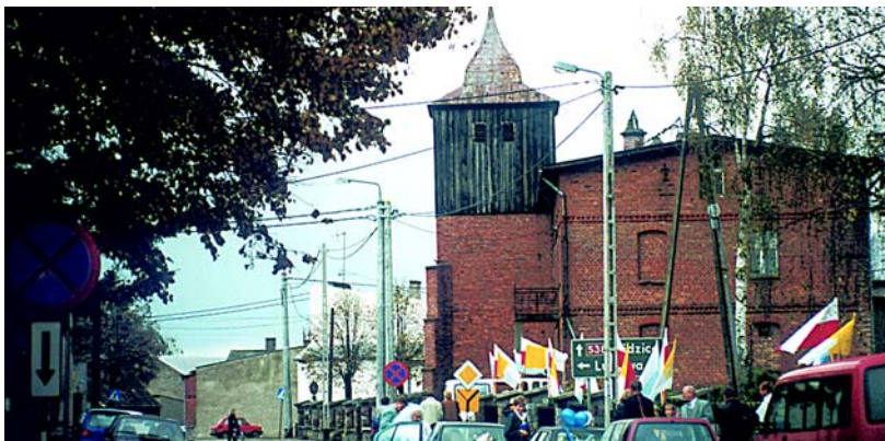
Rybno Pomorskie – kościół