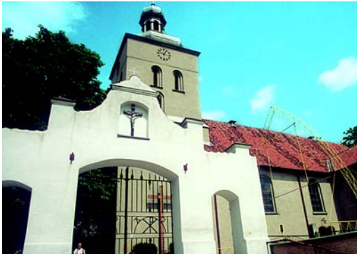
Kościół p.w. św. Wojciecha

W mieście zachowało się dużo obiektów przemysłowych z drugiej połowy XIX wieku i początku XX wieku. Są to 3 spichlerze z końca XIX wieku (ul. Piaski (obecny budynek szkolny), ul. Strażacka 2 (obecnie siedziba Miejsko-Gminnego Domu Kultury), ul. Stare Miasto 12, dwie wieże wodociągowe z 1909 roku, budynek garbarni z 1880 roku, budynek rzeźni z 1901 roku, budynek gazowni z 1903 roku (ul. Dworcowa 1), budynek cegielni z 1905 roku, budynek młeczarni z 1906 roku (ul. Chopina), budynek rozlewni mleka z około 1900 roku (ul. Chopina), 2 młyny wodne z końca XIX wieku (ul. Młyńska