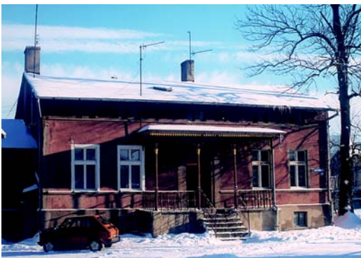
Dom przy ulicy Młyńskiej

Na wzgórzu, zwanym Górką, gdzie we wczesnym średniowieczu znajdowało się grodzisko słowiańskie, stoi dziś kościół ewangelicki. Został on zbudowany w latach 1928-1929. Świątynia ta jest zbudowana z cegły i otynkowana. Jest to budynek salowy, na rzucie prostokąta z dachem dwuspadowym, krytym dachówką. Z jego południowej strony wznosi się dwukondygnacyjna, czworoboczna wieża zakończona ostrosłupowym dachem krytym blachą. W elewacji wschodniej i zachodniej znajdują się półkolistie zamknięte otwory okienne. Elewacja południowa zamknięta jest trójkątnym szczytem z trzema półkolistymi zakończonymi oknami.