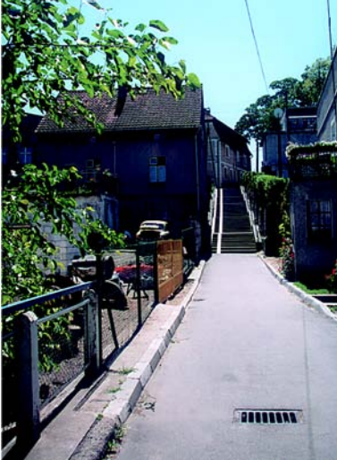
Baszta - widok od strony północnej

Miasto posiada od XIV wieku swój herb Jednorozca. Na niebieskiej tarczy znajduje się żółta głowa konia z rogami na czole. Od 1975 roku Lidzbark posiada również status miasta turystycznego.