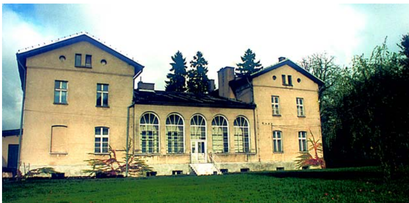
Tuczki – dwór