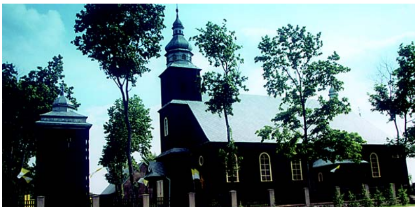
Koszelewy – kościół